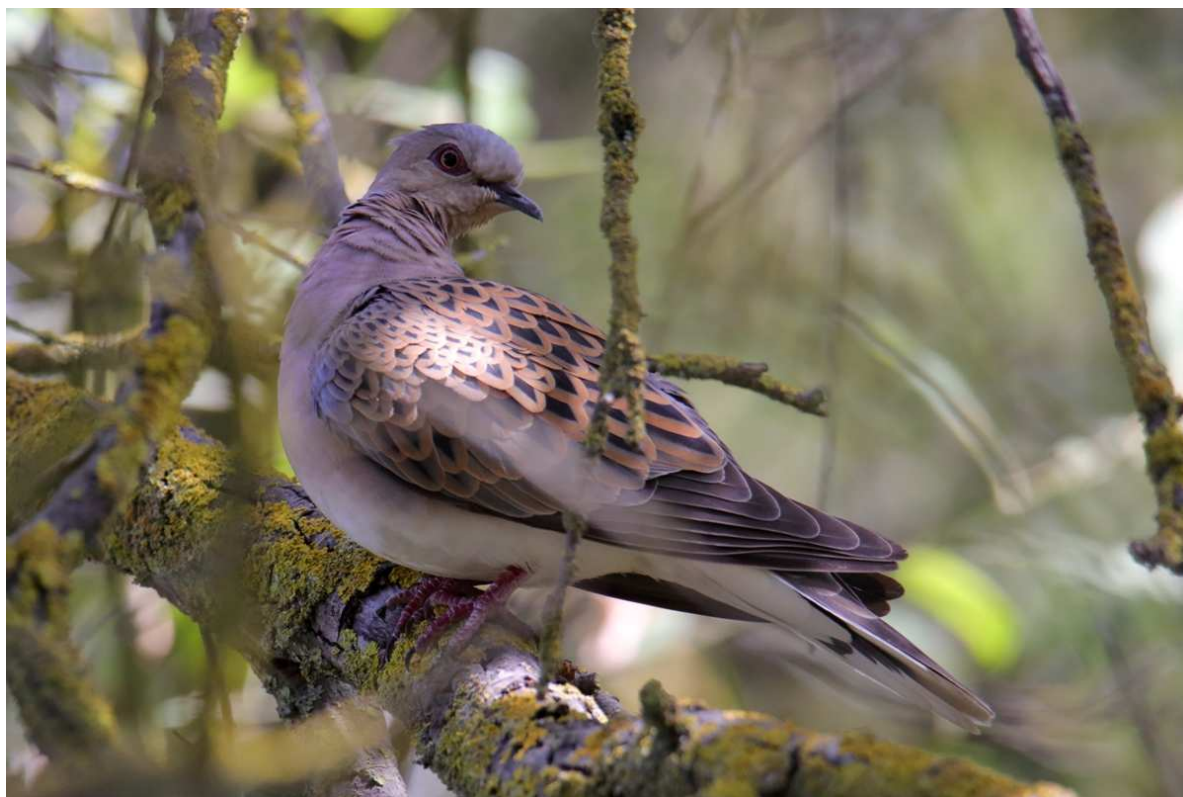
Vogel des Jahres 2020: die Turteltaube Streptopelia turtur .

Um unserer Informationspflicht nachzukommen, ist sowohl der Kassenbericht 2019 als auch der Tätigkeitsbericht 2019 (siehe 05.06.2020: Tätigkeitsbericht 2019) auf unserer Webseite eingestellt. Anmerkungen zu den Ausführungen in beiden Berichten können gern dem Vorsitzenden mitgeteilt werden.