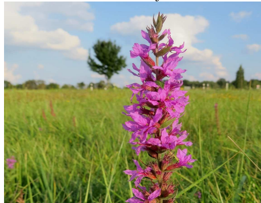
Blutweiderich Lythrum salicaria