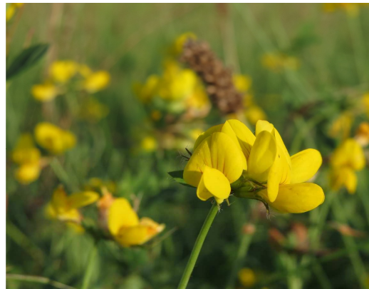
Gewöhnlicher Hornklee Lotus corniculatus