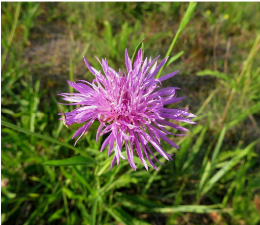
Wiesen-Flockenblume Centaurea jacea