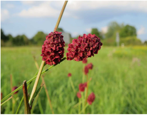
Großer Wiesenknopf Sanguisorba officinalis