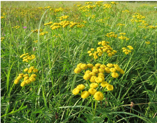
Rainfarn Tanacetum vulgare