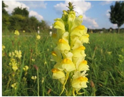
Echtes Leinkraut Linaria vulgaris