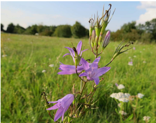
Wiesen-Glockenblume Campanula patula