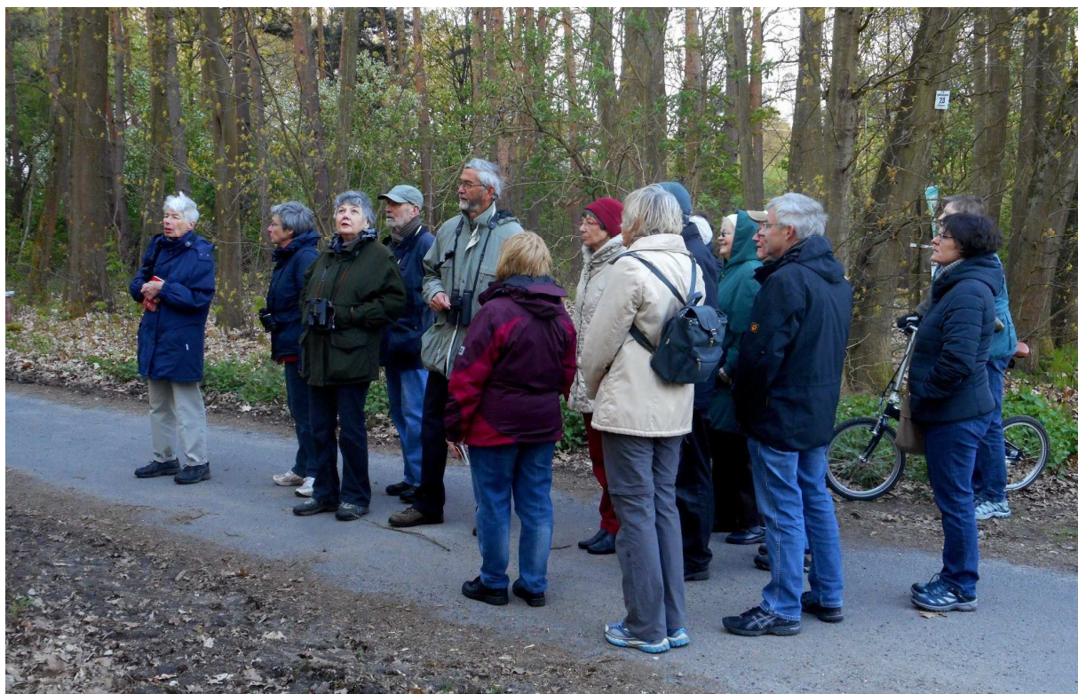
Stopp am Niederröder Weg, wo zwei Zaunkönige um die Wette sangen.

Im Verlauf der Wanderung entlang der Bieberbachaue und am Waldrand des Patershäuser Feldes waren die Rufe und Gesänge von 15 Vogelarten zu hören und weitere 11 Arten konnten beobachtet werden. Die flötende Strophe der Mönchsgrasmücke und das einfache Lied vom Zilpzalp wurden am häufigsten vernommen.