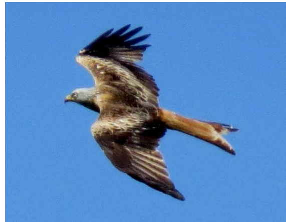
Rotmilan Milvus milvus im Flug

11 Teilnehmer hatten sich um 6:30 Uhr am Treffpunkt eingefunden. Diesmal führte die Wanderung entlang des Naturschutzgebietes Pechgraben bei Klein-Krotzenburg. Es handelt sich um Reste einer Hartholzau mit Eichen und Hainbuchen und üppigem Unterwuchs. Rot- und Schwarzmilan sind hier Brutvögel, beide imposanten Greife konnten im Flug beobachtet werden.