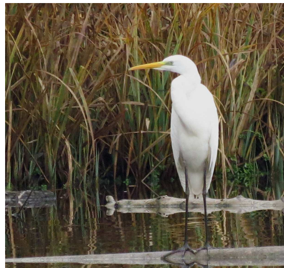
Silberreiher Casmerodius albus am Ufer des Angel Weihers. Der Vogel auf dem linken Foto steht direkt neben einem Kormoran Phalacrocorax carbo.