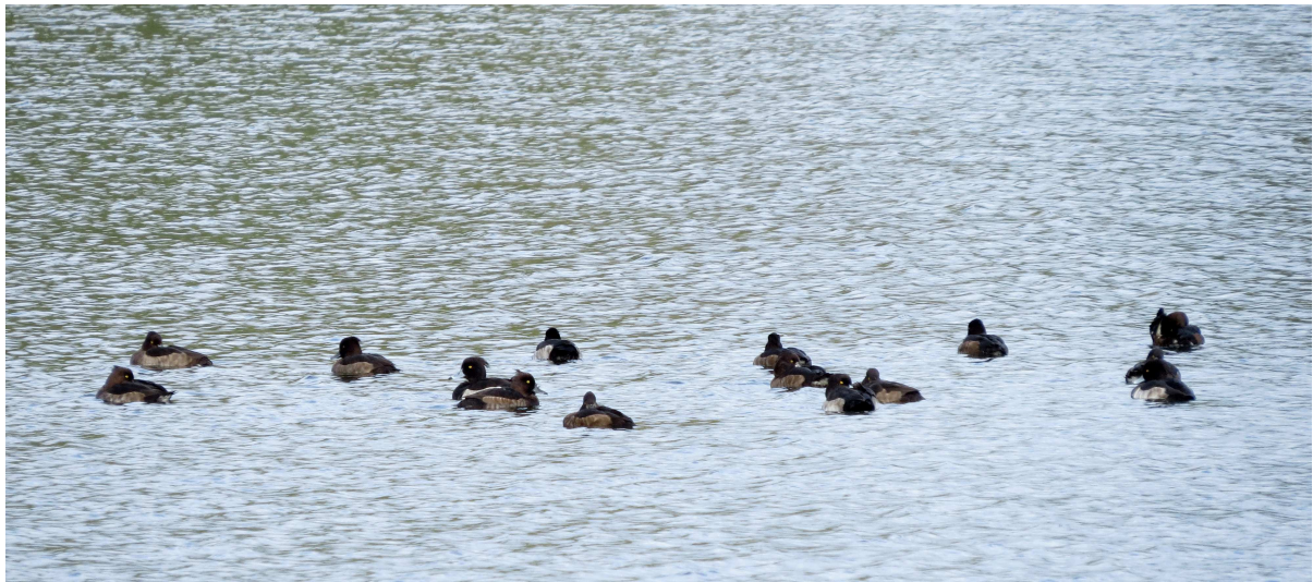
Auf dem Angelweiher rastende Reiherenten Aythya fuligula.

Wir erwarten, dass die Genehmigung zur Nutzung des Areals durch den ASV Obertshausen umgehend zurückgenommen wird.