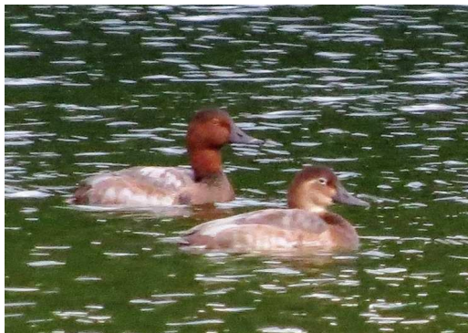
Im August erscheinen die ersten Tafelenten Aythya ferina auf dem Weiher; links das Männchen.

Das Teichhuhn Gallinula chloropus ist in den letzten Jahren vermehrt auf dem Angelweiher festgestellt worden. In der Brutzeit verhält es sich recht heimlich.