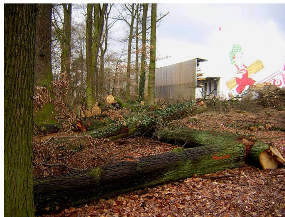
Anfang März wurde mit den Rodungen in dem nach EU-Recht geschützten Lebens- raumtyp Eichen-Hainbuchenwald begonnen.