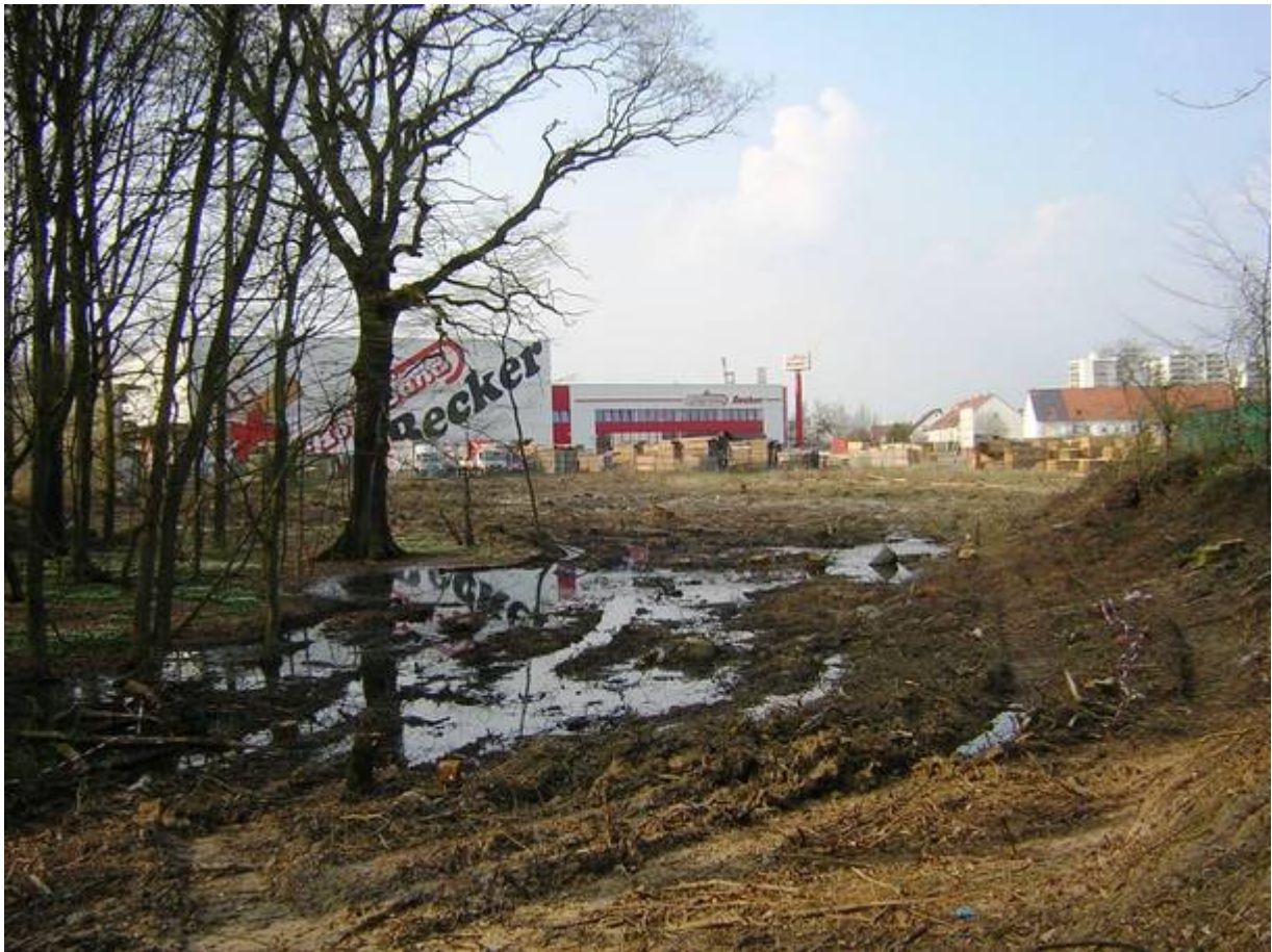
Von der Politik abgesegnet und plattgemacht – ohne sich ernsthaft mit der Thematik auseinandergesetzt zu haben: Teile des Eichen-Hainbuchenwaldes, Streuobstbestand und Feuchtwiese. Foto: 4.4.2009 P. Erlemann