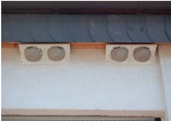
Kunstnester an einem Haus in der Friedrich-Ebert-Straße.

Die gegenwärtigen Vorkommen der Mehlschwalbe im Stadtteil Hausen sind recht weit zerstreut. Die Schwerpunkte befinden sich in der Gräfenwaldstraße und in der Friedrich-Ebert-Straße. Hier konnten acht künstliche Nisthilfen angebracht werden. Und wie die Kontrollen Anfang Juli ergaben, waren drei davon besetzt - es funktioniert also!