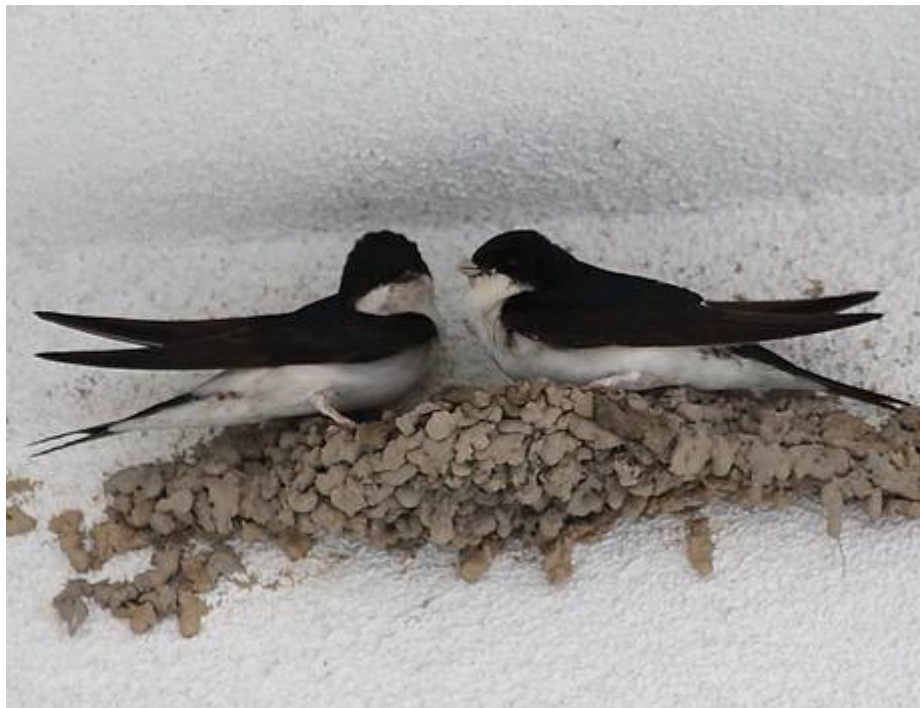
Mehlschwalbenpaar am begonnenen Nest - ein Bild, das heute nur noch selten bei uns zu sehen ist!

Interessenten melden sich bitte per E-Mail oder telefonisch. Wir nehmen mit Ihnen eine Ortsbesichtigung vor und besprechen die Details.